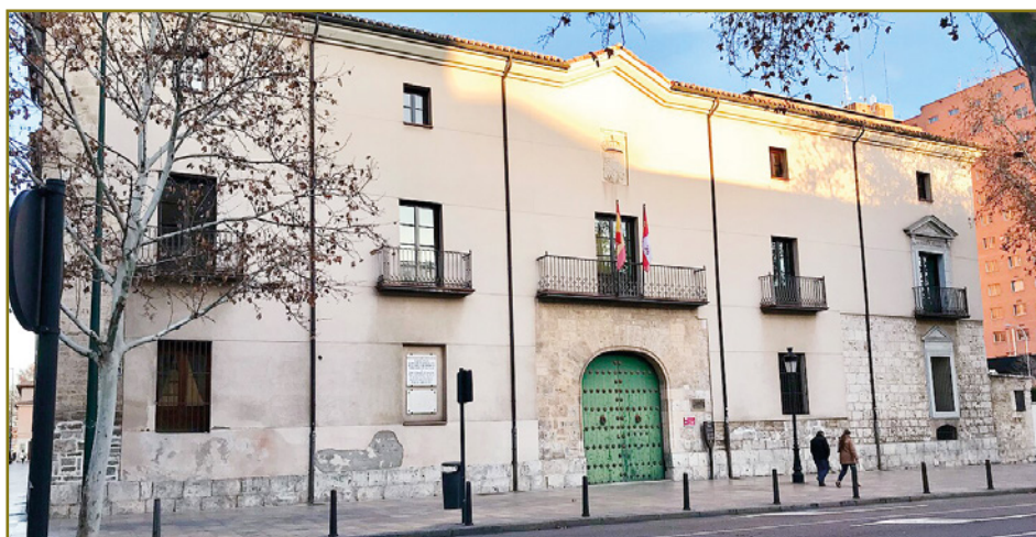
PALACIO DE LOS VIVERO. VALLADOLID

La sede consta de sala de sesiones, biblioteca, secretaría y despachos y equipos de ofimática, proyección y sonido.