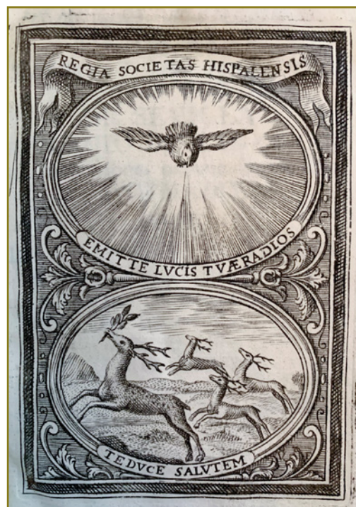
SELLO DE LA ACADEMIA DEL AÑO 1737

El sello que utiliza la Academia para identificar sus documentos es el primitivo escudo de la misma de 1737. De forma rectangular, tiene dos óvalos; en el superior está el Espíritu Santo en forma de paloma, de la que parten rayos "para que ilumine el conocimiento de sus socios". En la parte baja unos ciervos simbolizan la agilidad, la salud. El primero lleva en la boca la rama de una planta, pues era creencia que los ciervos se curaban ellos mismos eligiendo la planta adecuada. En este sello se reproduce la leyenda "Regia Societas Hispalensis" en la parte superior, y en los pies de los óvalos "emitte lvcis tvaе radios" y "te duce salvtē".