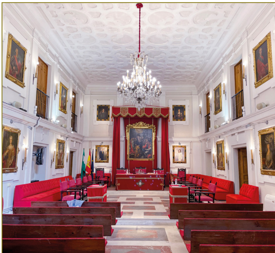
SALÓN RAMÓN Y CAJAL