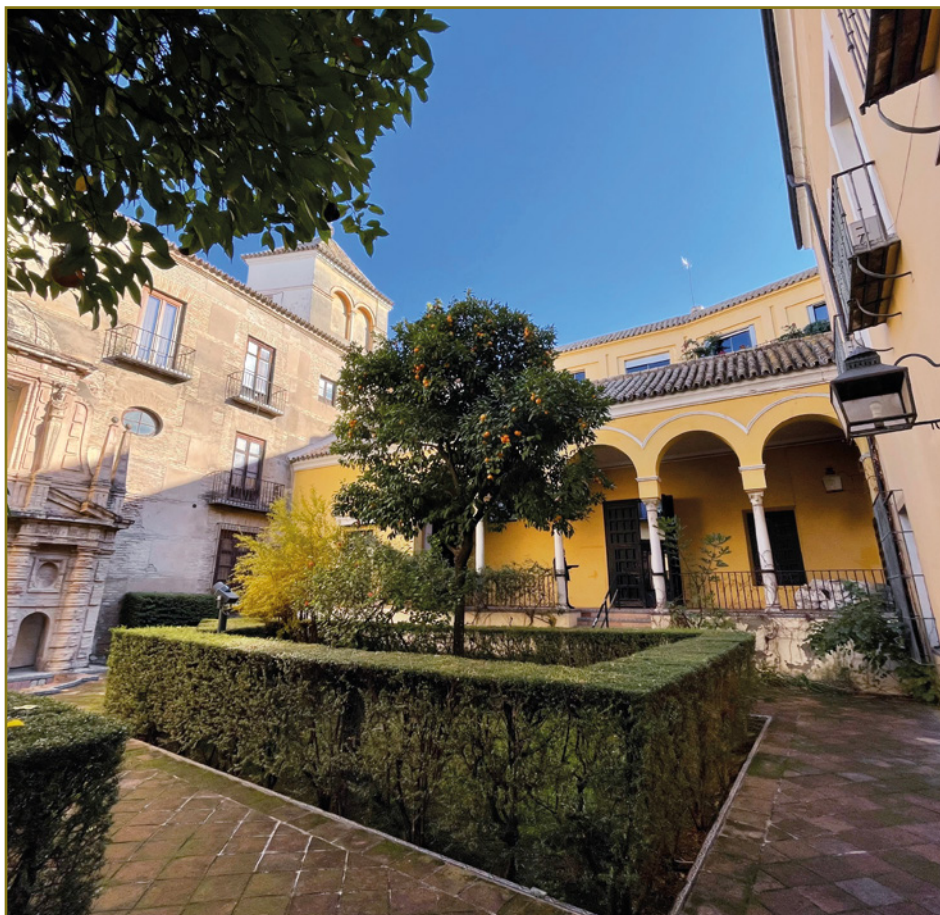
PATIO Y LOGIA DE ENTRADA DE LA SEDE ACTUAL DE LA RAMSE EN CALLE ABADES