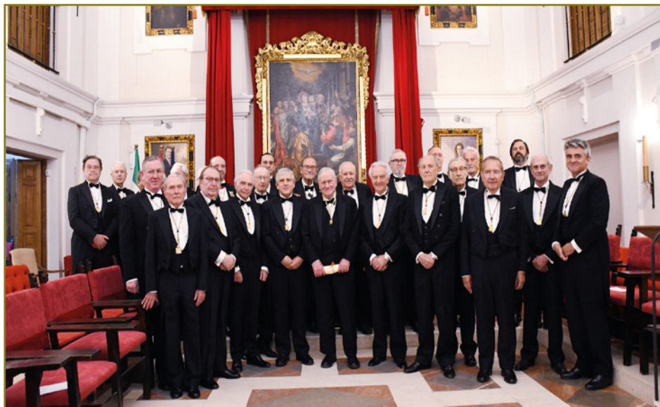
RECEPCIÓN SOLEMNE DEL DR. VALENTÍN FUSTER