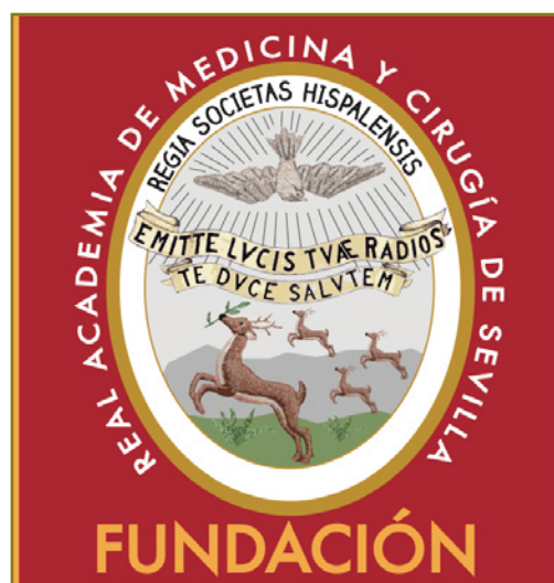
ESCUDO DE LA FUNDACIÓN RAMSE