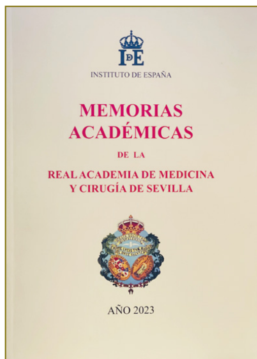
MEMORIA DE LA RAMSE DEL AÑO 2023

de una librería que fue enriquecida a lo largo de sus más de trescientos años de existencia ininterrumpida. La actual biblioteca guarda más de 20 000 libros, de los cuales 902 constituyen el fondo antiguo, con obras anteriores a 1826, incluyendo incunables y postincunables. 568 de ellos están digitalizados y pueden consultarse en la página web de la RAMSE. La Academia imprime anualmente las Memorias Académicas.