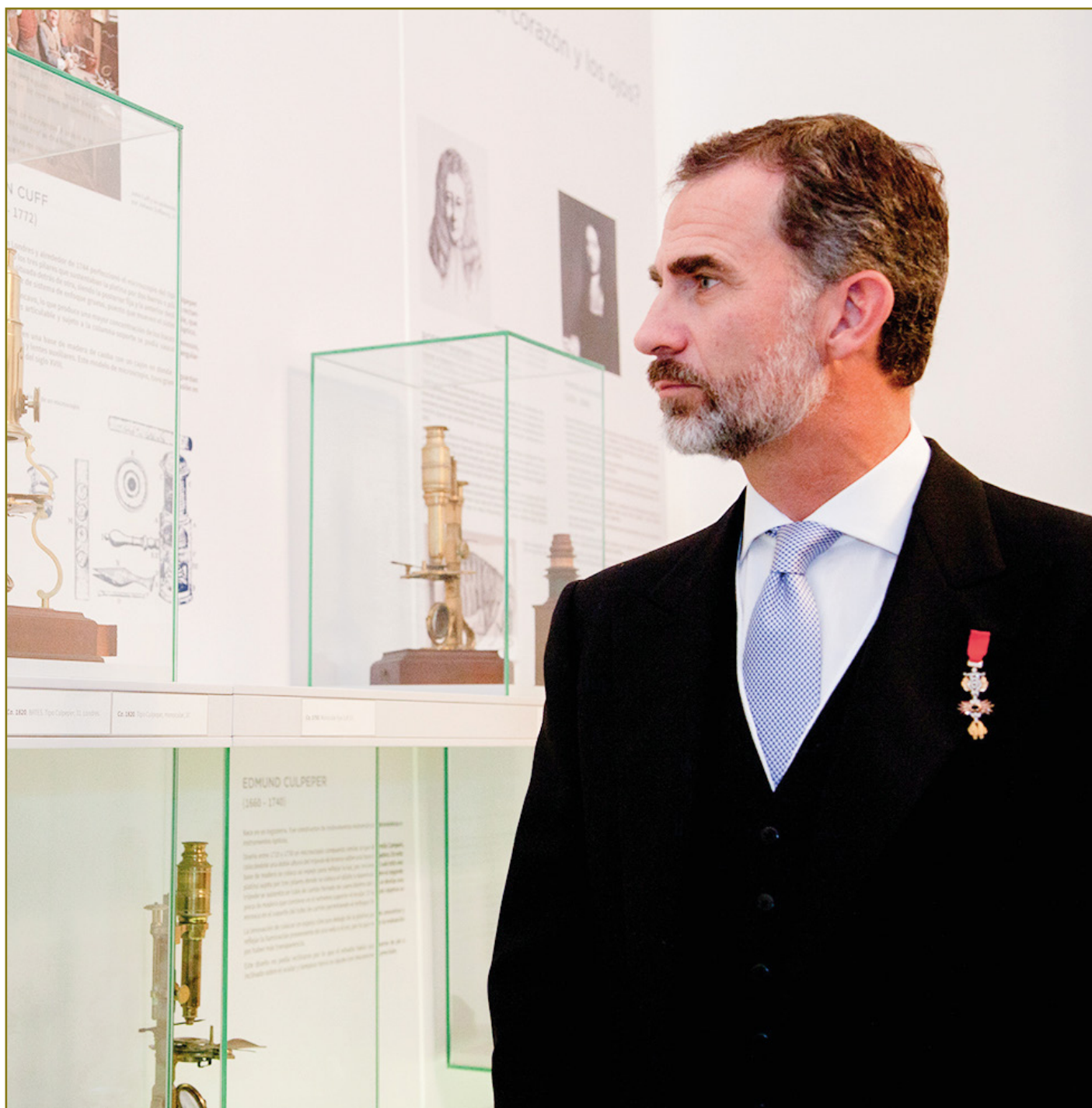
S.M. EL REY FELIPE VI EN SU VISITA A UNA DE LAS EXPOSICIONES DEL MMIM EN LA SEDE DE LA RANME