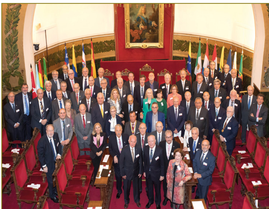
PRESIDENTES Y REPRESENTANTES DE LAS ACADEMIAS PERTENECIENTES A ALANAM EN EL ACTO DE PRESENTACIÓN DEL DPTM EN NOVIEMBRE DE 2023

A finales de 2024 se llevó a cabo la publicación del DPTM en formato libro, con un total de 500 ejemplares, para que pueda ser depositado en las más importantes bibliotecas de España y Latinoamérica y en sus Academias.