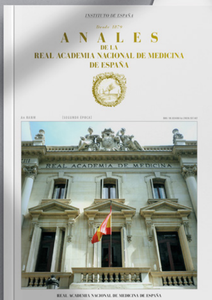
REVISTA ANALES RANM