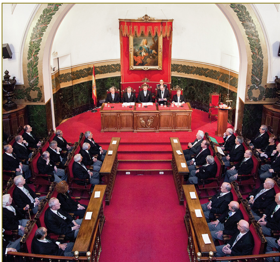
SESIÓN INAUGURAL DEL CURSO DE LAS REALES ACADEMIAS EN EL AÑO 2016 PRESIDIDA POR S.M. EL REY EN LA RANME

Lo concerniente a todas estas sesiones puede consultarse en la página web www.ranm.es .