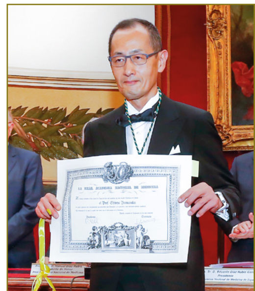
DR. SHINYA YAMANAKA (NOBEL 2012), MEDALLA DE HONOR DE LA RANME (2022)