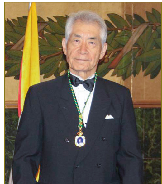
DR. TASUKU HONJO (NOBEL 2018) MEDALLA DE HONOR DE LA RANME (2019)