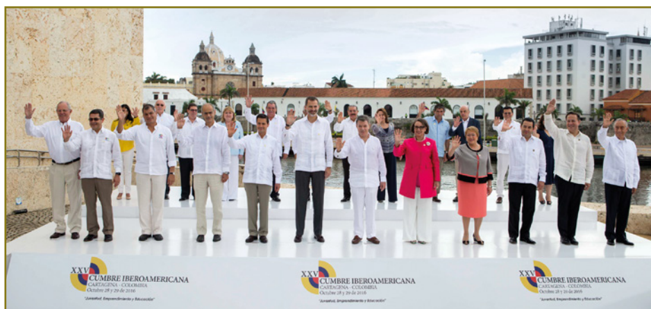
JEFES DE ESTADO Y DE GOBIERNO DE LOS 22 PAÍSES IBEROAMERICANOS FIRMANTES DE LA DECLARACIÓN DE CARTAGENA. XXV CUMBRE IBEROAMERICANA (2016)

El DPTM es una gran obra colectiva y consensuada de las Academias de Medicina de habla hispana.