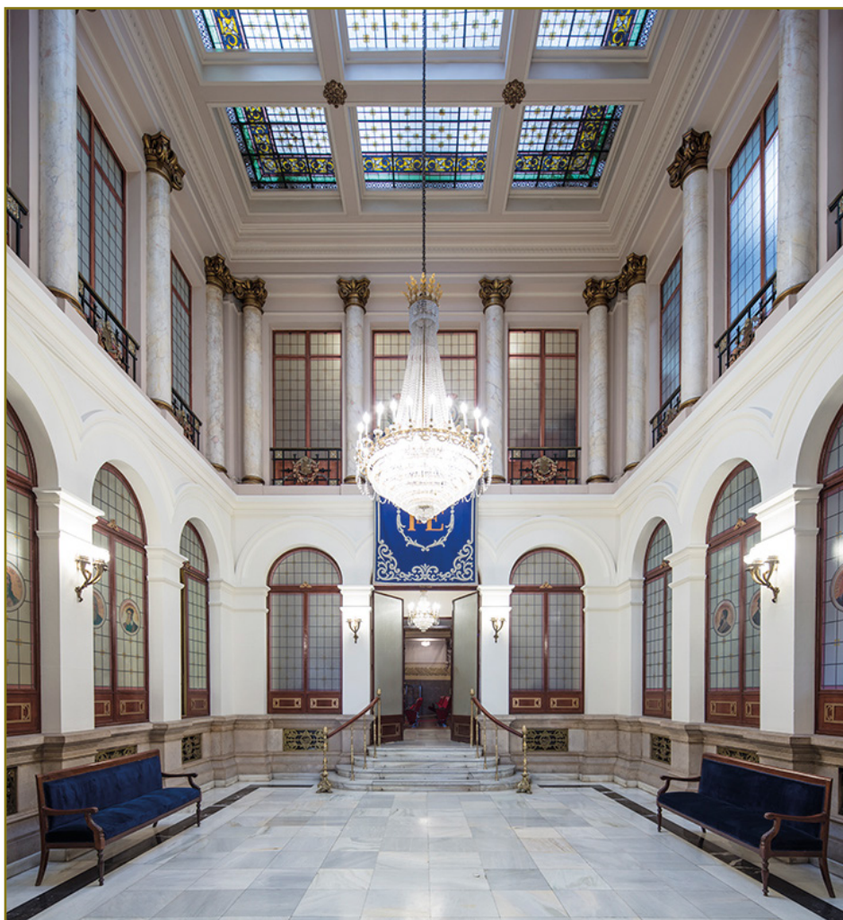
PATIO DE HONOR

cinco académicos de número, tres académicos correspondientes y tres personas físicas o jurídicas externas. Sus actividades se centran en la obtención de fondos, cuyos fines van destinados a la edición y difusión de publicaciones científicas; la organización de conferencias, jornadas, debates y coloquios sobre la medicina, la salud y la sanidad; el fomento de encuentros científicos; los premios, y la promoción de actividades conjuntas con la Real Academia.