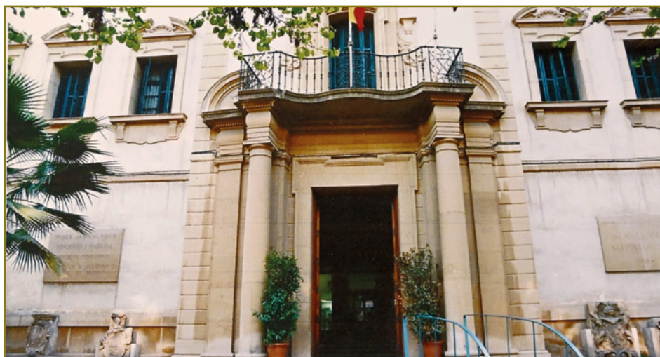
MUSEO ARQUEOLÓGICO DE MURCIA