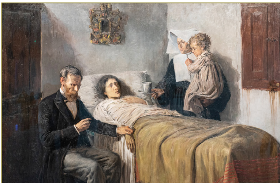
PABLO PICASSO. CIENCIA Y CARIDAD (1897)