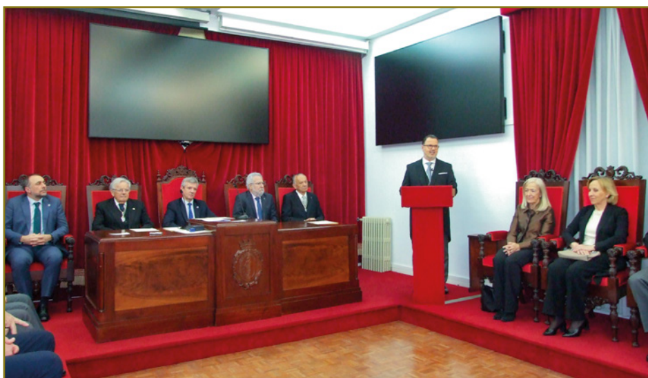
SOLEMNE SESIÓN CELEBRADA EN EL SALÓN DE ACTOS