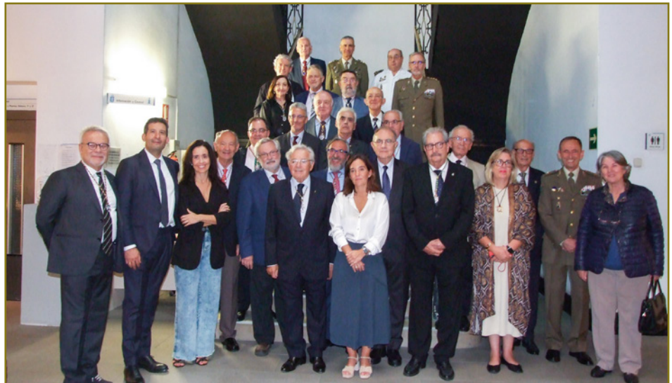
MIEMBROS DE LA RAMG Y LA RANME JUNTO A REPRESENTANTES DE LA ADMINISTRACIÓN PÚBLICA Y MILITARES ASISTENTES A LA INAUGURACIÓN