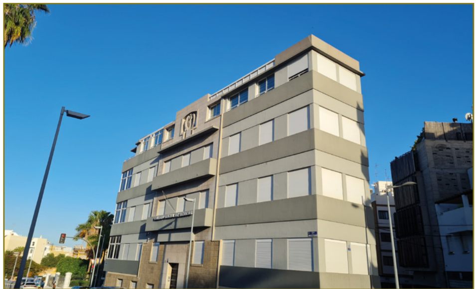
ILUSTRE COLEGIO OFICIAL DE MÉDICOS DE SANTA CRUZ DE TENERIFE

Por último, en 1959 se trasladó al edificio del Ilustre Colegio Oficial de Médicos en esta capital, sito en la calle Horacio Nelson, Nº17, C.P. 38006, donde en la actualidad (2024) continúa al no poseer aún una sede propia y al que agradecemos su amable acogida; aquí, y desde hace ya 65 años, tienen lugar todas los actos académicos.