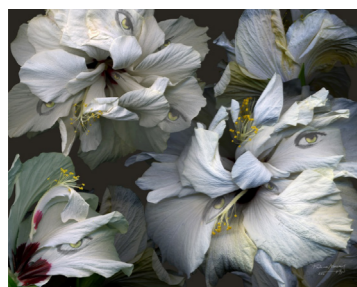
ALEGRES ERAN MIS OJOS Paloma Navares