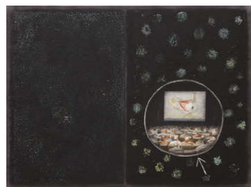
LOCALIZACIÓN EN EL COSMOS DE GENTE OBSERVANDO UN OJO Cristóbal Toral