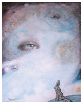
EL COSMOS NOS MIRA Polín Laporta