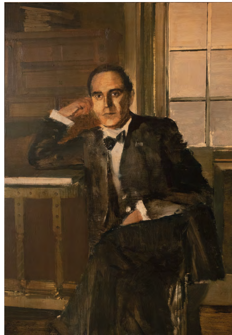
[4] Sergio Rocafort Don Gregorio Marañón Óleo sobre tabla | 70 x 100 cm